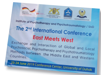
Die Mainzer Kollegin nahm im Juni an der Konferenz »East meets West« der Universität Dohuk im Nord-Irak teil.

Denn auch wenn in Kurdistan relativer Friede sowie eine gewisse Autonomie gegenüber dem Irak herrscht, hält man sich doch in einer Region auf, in der viele Menschen über lange Zeiträume strukturelle Gewalterfahrungen im Rahmen einer systematischen Kurdenverfolgung gemacht haben. Auch derzeit erfolgen im Norden einzelne, gezielte