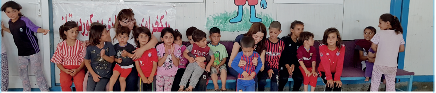
Viele der in den Lagern lebenden Frauen und Kinder wurden vom IS missbraucht, versklavt oder als Kindersoldaten ausgebildet und waren unvorstellbaren Grausamkeiten ausgesetzt.

Zelten wohnen und es kaum Angebote an Schule oder medizinischer Versorgung gibt. Psychotherapeutische Unterstützung erhalten nur sehr wenige, obwohl sie dringend benötigt wird.