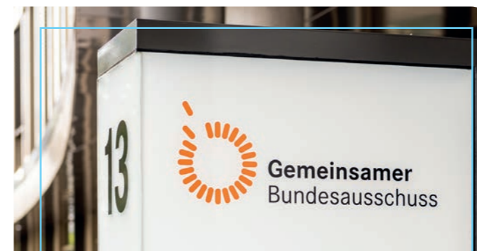
Der G-BA fördert die Studie mit 9,5 Mio. Euro.

Weitere Informationen zum Früherkennungs- und Therapiezentrum für psychische Krisen (FETZ Rheinhesse) über unsere Internetseite rheinhesse-fachklinik-alzey.de .