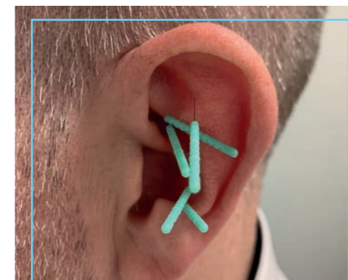
Ohrakupunktur nach NADA etablierte sich in der RFK Alzey.