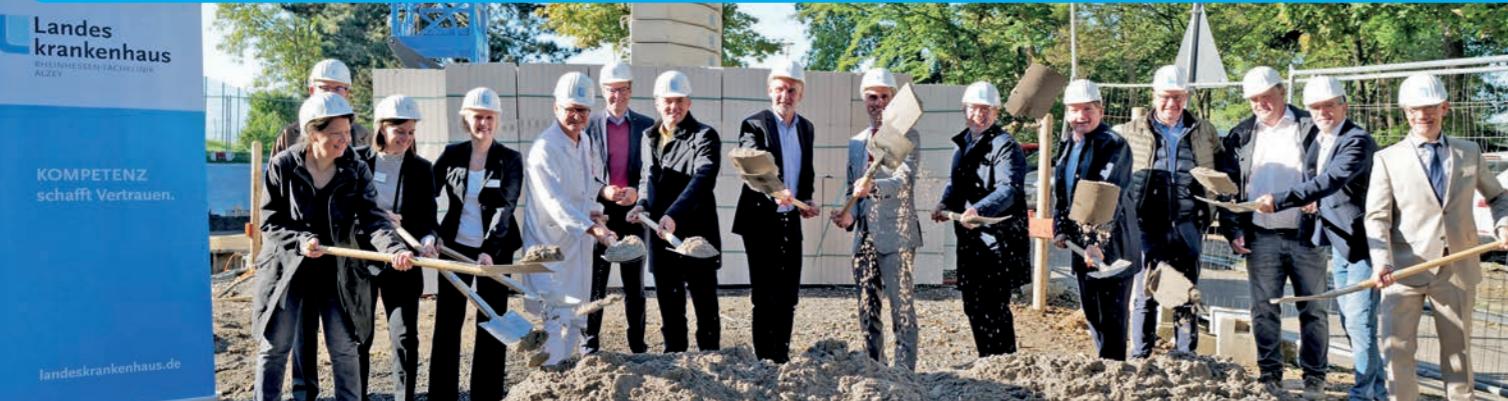
Mit dem symbolischen Spatenstich wurden die beiden Bauprojekte offiziell gestartet.